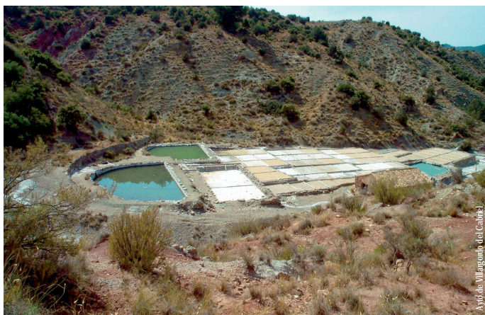
Ayuntamiento de Villargordo del Cabriel